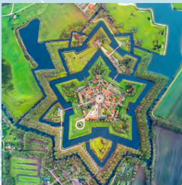
Luchtfoto van de gerestaureerde vesting Bourtagne