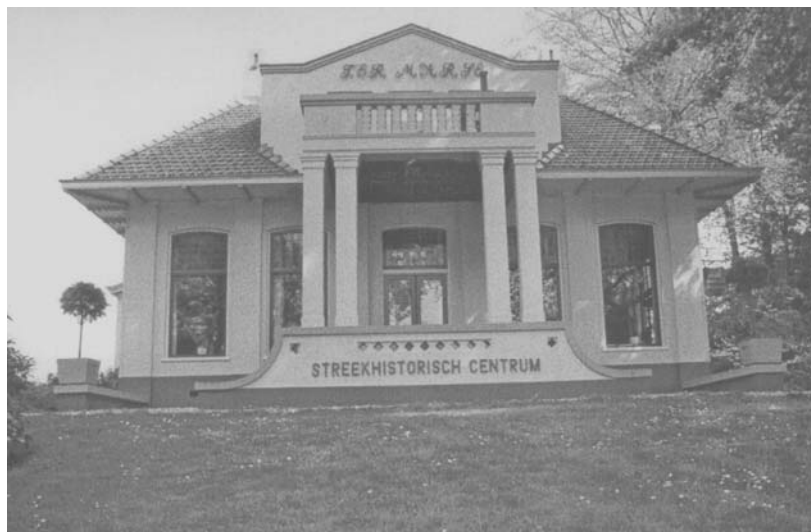
Foto van het huidige pand