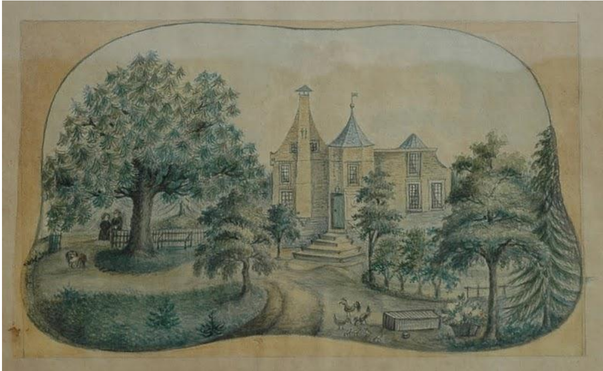
2 19e eeuwse tekening van de burcht

Uiteindelijk was in 1619 de macht van de stad Groningen zo gegroeid, dat zij de heerlijkheid Westerwolde konden kopen. Bijna twee eeuwen lang werd – tot aan het begin van de Franse revolutie – van de aangestelde Drost verwacht dat zij de stadsheerlijkheid Westerwolde ‘onder de knoet’ hielden. Angst heerste echter niet alleen voor, maar ook achter de bakstenen in de Burcht en het dorp. Een gebeurtenis die tot de verbeelding spreekt, is de pest. Volgens archivalia heerste die nog onder bewoners en hun personeel van de Burcht in 1666 zo hevig, dat de burggraaf Haselhoff zijn zes kleindochters en zijn schoonzoon verloor. Ook toen zullen de emoties hoog opgelopen zijn. Deze bekende familie Haselhoff hebben de Drost vele generaties lang staatkundig bijgestaan. De raadsleden van de stad Groningen zagen het na de Franse tijd spoedig niet meer zitten met de Burcht in Wedde. De rechtspraak verschoof naar Winschoten en daarmee ook de laatste baljuw De Sitter. Het eeuwenoude feodale tijdperk was ten einde gekomen en daarmee ook de bijzondere rol van de Burcht in Westerwolde. In 1828 was de gemeenteraad zover dat de Burcht wel gesloopt mocht worden!