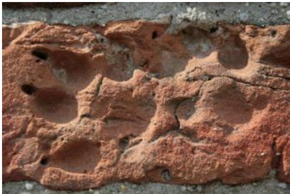
1 Afdruk van een wolvenklauw in één van de bakstenen

De oudste bakstenen van de Wedder Burcht hebben een geschiedenis van bijna 650 jaar. Andere zijn nauwelijks zestig jaar oud. Volgens bouwhistorici zijn de bakstenen van de kelder waarschijnlijk afkomstig van het eerste steenhuis uit de tweede helft van de 14e eeuw. De huidige kelder bestaat uit stenen van circa 1486. De stenen van de ringmuur, bastions en het poortgebouw stammen uit de eerste helft van de 16e eeuw. Grote delen van de noordvleugel zijn 16e tot de 18e-eeuws, maar er zijn ook 19e-eeuwse gedeelten. De zuidvleugel en traptoren zijn merendeels 16e en 17e-eeuws, maar bij de ingrijpende restauratie in 1955 deels hergebruikt. Het afgelopen jaar is er weer een paragraaf toegevoegd aan die rijke bouwhistorie. Bij die historie en de toekomstplannen van de stichting de Burcht Wedde staan we hier even stil.