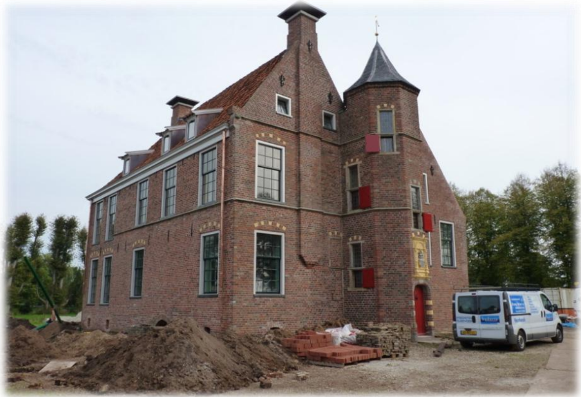
4 De burcht, net ontdaan van de steigers

een kinderhotel, een restaurant en een 'half museum'. Er is gesproken met een bekende conservator, die al vele steenhuisen en borgen had ingericht. Hij bedankte al snel voor de eer bij het horen van de complexe opdracht. Ook met een landelijk bekende interieurontwerper kwam het bestuur er – o.a. vanwege de financiën - niet uit. Thans werken twee jonge ontwerpers Sander en Sabine samen met de directeur van het museum 'de Buitenplaats' Geert Pruiksmā. En het gaat lukken! Elke ruimte krijgt in de Burcht een functionele inrichting met een vette knipoog naar een bepaalde fase in de historie van de Burcht zoals o.a. de tijd van de Drost en de familie Koning. Bij de voorbereidingen en de uitvoering van de bouw is er professioneel en opnieuw met veel passie meegewerkt door diverse bureaus, zoals Invent en O.V.T. Architecten. De laatstgenoemde weet als weinig anderen zorgvuldig om te gaan met de oude bakstenen in de Burcht. OVT staat ook bij de Burcht niet voor niets voor Onvoltooid Verleden Tijd, omdat ook de Burcht niet voltooid is, maar door toedoen van de stichting een nieuwe fase in zijn bestaan ingaat. De verbouwing is inmiddels gereed en het gebouw is voorzien van de beste installaties, die voldoen aan de jongste