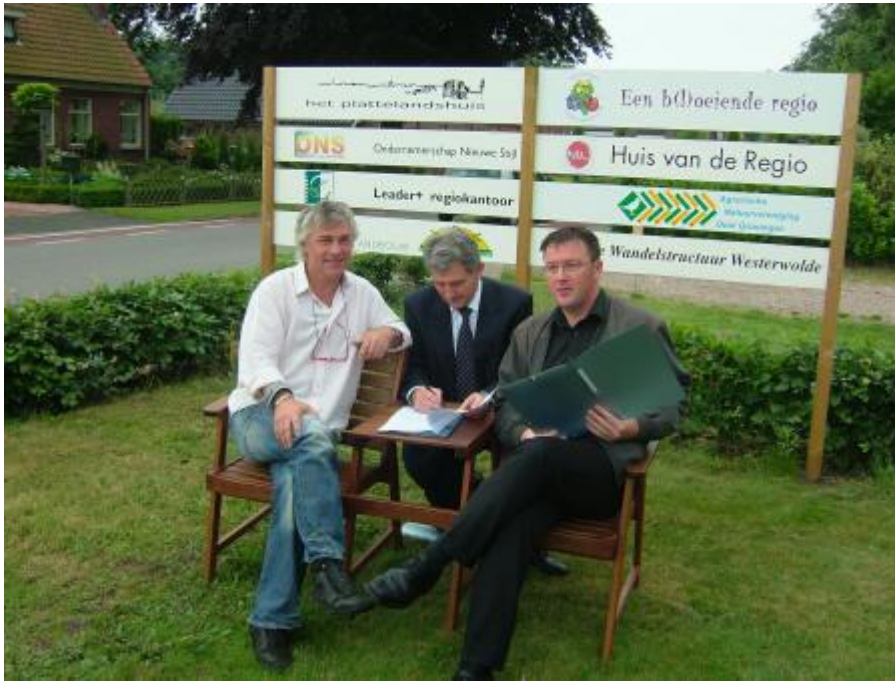
3 De initiatiefnemers