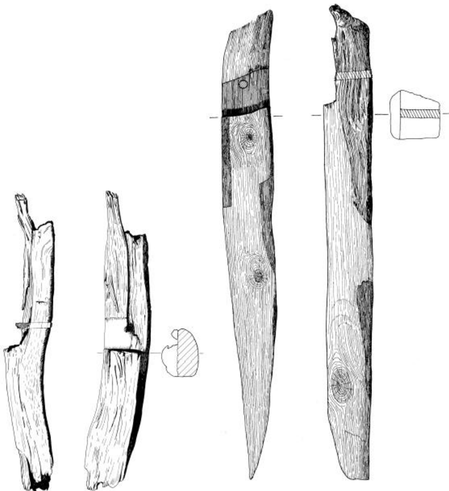
Afbeelding 2 Links: brugpaal 1, rechts: brugpaal 2. Schaal 1:10. Tekening: Bart Huizenga.

werkt en hebben een rechthoekige doorsnede. Paal 1 is 1,15 m lang en 0,20 m in het vierkant. De paal is aan beide zijden afgebroken. Aan één uiteinde is een brede inkeping gemaakt, waarin nog een pen-en-gatverbinding is te zien. Paal 2 is 1,90 m lang en is 0,20 m in het vierkant. De paal is aangepunt en heeft eveneens aan één kant een brede inkeping met een pen-en-gatverbinding. Duidelijk zijn de kapsporen aan de punt te zien. De eiken palen zijn volgens een ooggetuige onder de Weenderstraat weg gegraven, zonder dat hier een notitie van gemaakt is. Met grote zekerheid zijn het onderdelen van een oude brugconstructie, die over de Ruiten Aa heeft gelegen. Na overleg met mw. drs. A. Mennens-van Zeist (Libau) zijn de palen meegenomen voor een dendrochronologisch onderzoek. Beide palen zijn door middel van dendro-chronologisch onderzoek gedateerd. Alleen paal 1 heeft een positief resultaat opgeleverd. De boom, waaruit paal 1 is gemaakt, is rond het jaar 1125 n. Chr. gekapt. Van paal 2 waren het aantal jaarringen te weinig en grof om te kunnen dateren. Tijdens de begeleiding zijn geen palen of ander houtwerk aangetroffen.