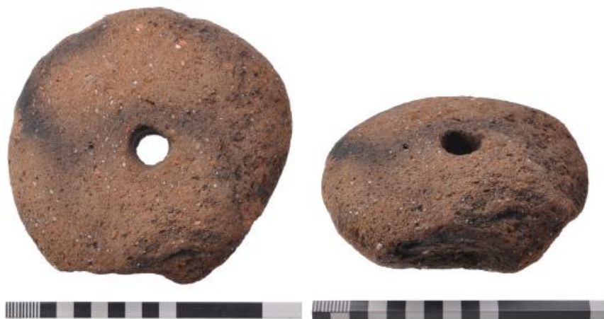
Afbeelding 7 Weefgewicht, vondstnr. 3, boven en zijaanzicht.

maakt van roodbruin bakkende baksteen, germagerd met graniet- en baksteengruis. Oudtijds zijn er fragmenten van het gewicht afgebroken. De ophanggat vertoont lichte slijtagesporen. Dit type gewicht is vaker in laatmiddeleeuwse vondstcontexten aangetroffen, onder andere in en om Winschoten.