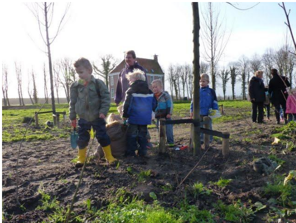
5 Kinderen planten stinzenbollen

gementen. Samen met de professionele organisaties zoals b.v. Elker en Humanitas, wordt het verblijf op de Burcht georganiseerd. Ook hiervoor zal er nog veel werk verzet worden om e.e.a. uiteindelijk komende zomer (financieel met name) geregeld te hebben. De kinderen krijgen straks de kans om in een echt 'kasteel' weg te dromen van de trieste thuissituatie naar de tijden van Floris, Ivanhoe, Robin Hood of Assepoester. Dit wegdromen levert hopelijk nieuwe energie op en door de positieve emoties zullen ze nog lang terugdenken aan de Burcht in Wedde en de fraaie omgeving.