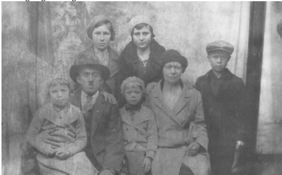
foto 1, wie heeft de familie Kampenga gekend. Zij hebben in Veelerveen en de nw Barlage gewoond in de periode mei 1921 t/m mei 1922 en september 1922 tot februari 1930.