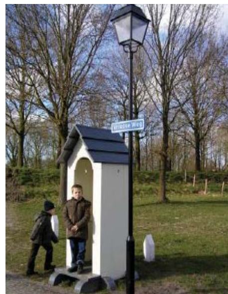
afb. 4 Deze lantaarns zijn geplaatst in het kader van het TRIP project

Binnen het TRIP-project is samengewerkt met tal van partijen zoals gemeenten, recreatieondernemers, particuliere terreineigenaren en aannemers. Er is voor diverse fysieke aanpassingen gezorgd waaronder parkeergelegenheid, informatiepanelen, verlichting, aanlegsteigers, beplantingen, voet-, fiets- en ruiterspaden. Daarnaast zijn nieuwe of aangepaste toeristische routes en arrangementen ontwikkeld en gepubliceerd. Ook is er een aantal historisch waardevolle elementen hersteld of geaccenteerd en daarmee beter leesbaar gemaakt: