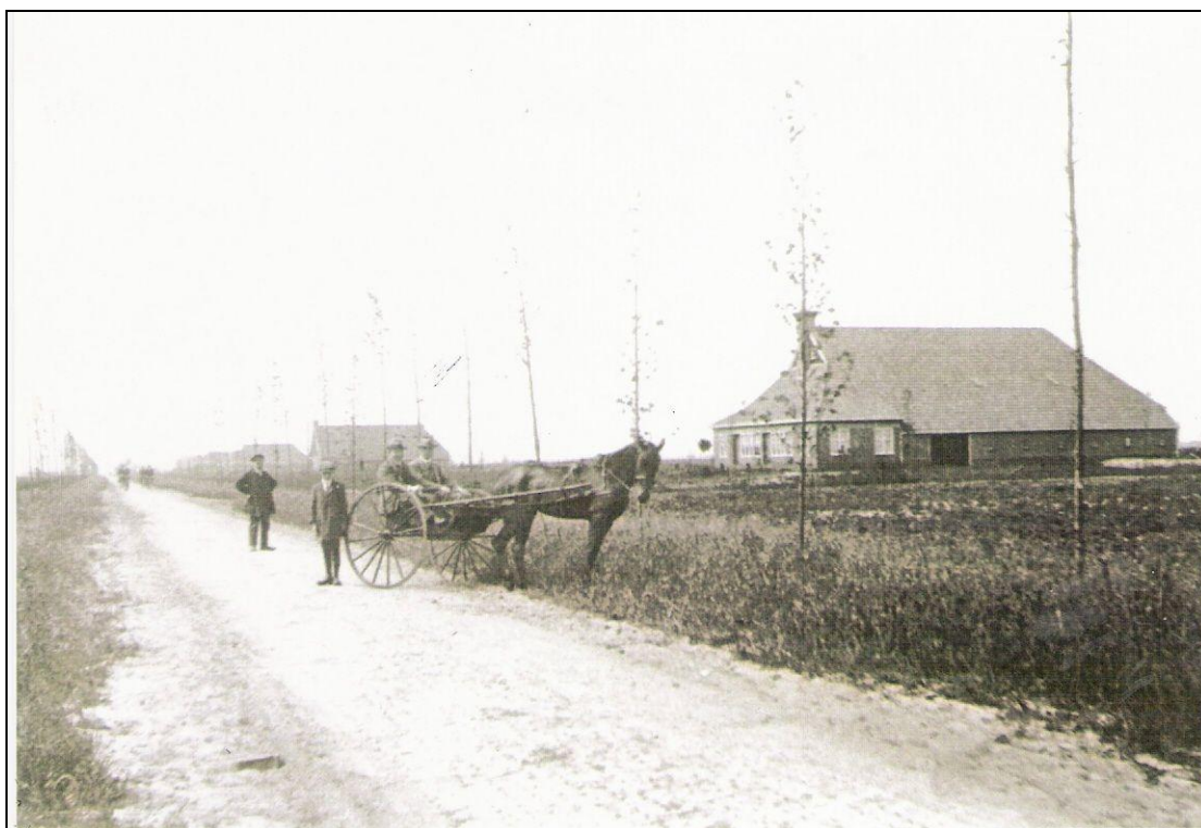
Afb 1. Het Hebrecht, begin jaren 20

In jaargang 28 nr. 2 plaatsten we het eerste deel van wat een reeks over Het Hebrecht en Veelerveen had moeten worden. Graddus Nobbe bracht er zijn jeugd door en zat vol met verhalen en anekdotes over deze streek. Onderstaand artikel lag nog op de plank. Helaas was het hem niet gegeven om meer afleveringen te schrijven.