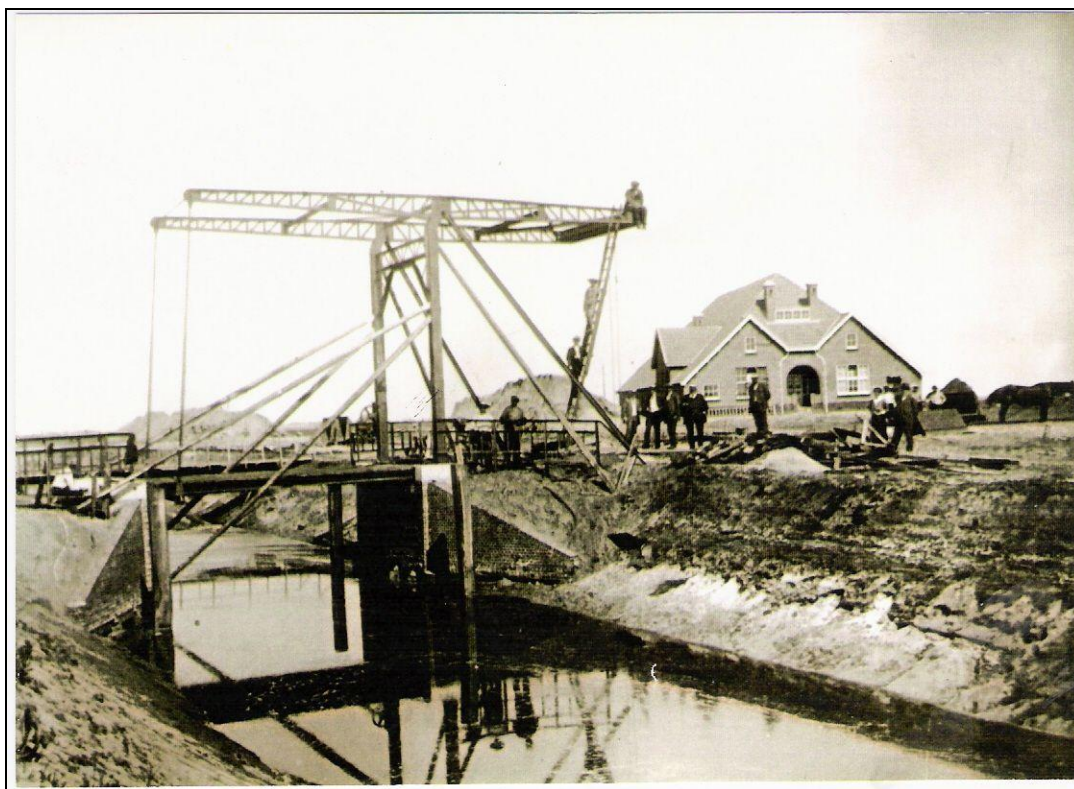
Afb 3. Boerderij nr. 2

Ook enkele ander boerderijen zijn in de loop der jaren verkocht aan de bewoners. In 1950 woonden er de volgende families: