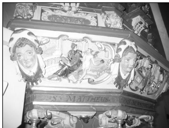
3 Detail van de kansel met de evangelist Mattheus

eeuwen definitief achter ons hebben gelaten. Eveneens van Münstermann is de prachtige kansel, eveneens in rijke maniëristische stijl met reliëfs, ornamenten en beelden versierd. De plint vertoont de vier Evangelisten, de kuip de profeten Jesaja, Jeremia, Ezechiël en Daniël tussen hermenpilasters, die de deugden symboliseren. Het verhoudingsgewijs kleine klankbord met een hoge bekroning is o.m. rijk geornamenteerd met medaillons van de Kerkvaders. Net als in Sillenstede stonden we stil bij tal van elementen uit het interieur en meubilair, w.o. de doopvont uit plm. 1260, een epitaaf uit 1640, wijdingskruisen enz. Op voorstel van de rondleidster zongen we na afloop een lied uit het Lutherse gezangboek (begeleid op het orgel uit 1694, 1884 en 1974), waarvan de tekst geschreven is door de grote Lutherse predikant-dichter Paul Gerhardt (1607-1668), wiens 400-jarig geboortejubileum dit jaar in Duitsland is herdacht (Paul Gerhardtjahr).